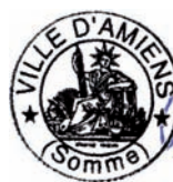
le Maire Gilles de Robien